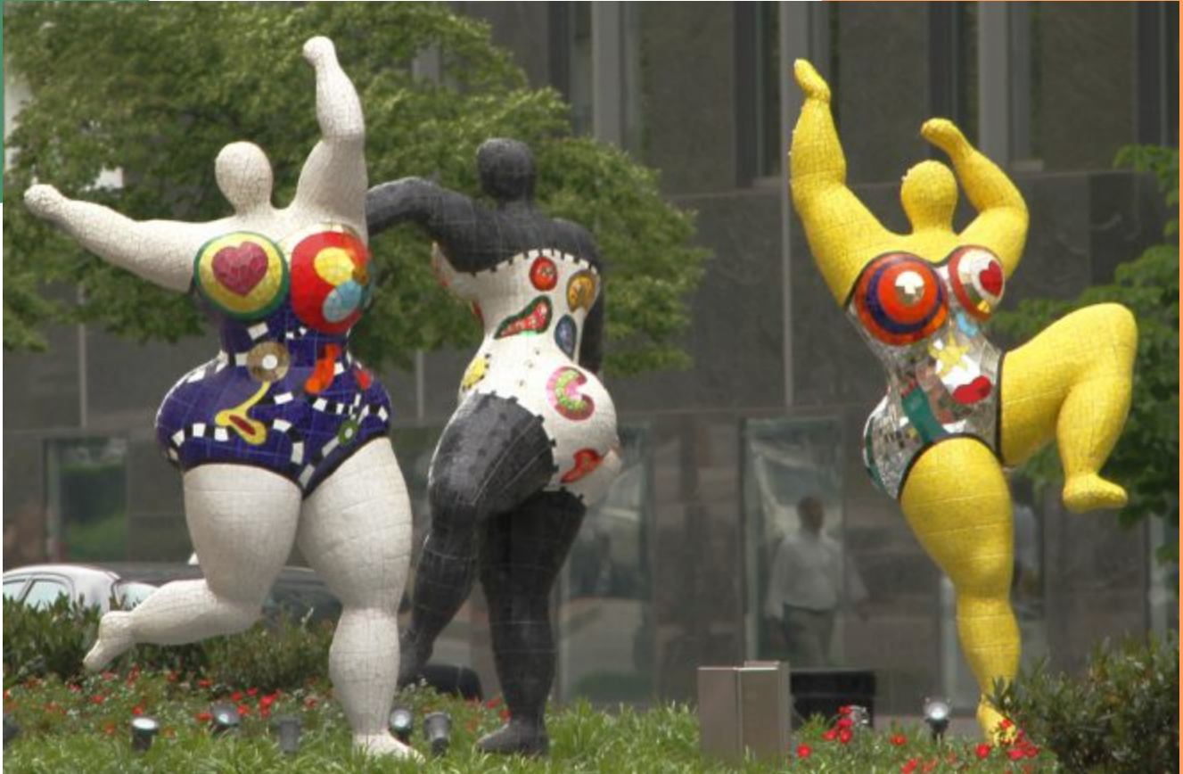
Niki de Saint Phalle, Les Trois Grâces, 1999

Niki de Saint Phalle est une plasticienne, peintre, sculptrice et réalisatrice française (rien que ça), née en 1930. Elle a tout d'abord été mannequin, et a appris l'art par elle-même. Elle participe à l'exposition Le Nouveau Réalisme à Paris et à New York, et crée ses fameuses Nanas, femmes colorées en grillage, polyester et papier mâché.