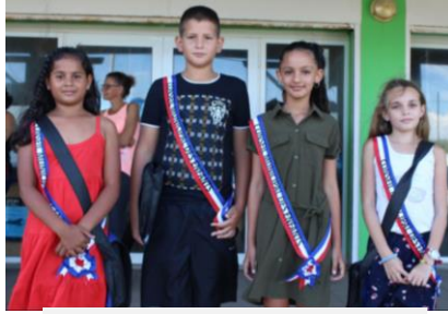
Le conseil municipal des enfants

Dans chaque commune, les habitants élisent des conseillers municipaux. Ceux-ci désignent un maire ou une maire. Les élections municipales ont lieu tous les 6 ans. La municipalité prend des décisions pour la commune ( construction de bâtiments, gestion des déchets, création d'une piste cyclable...).