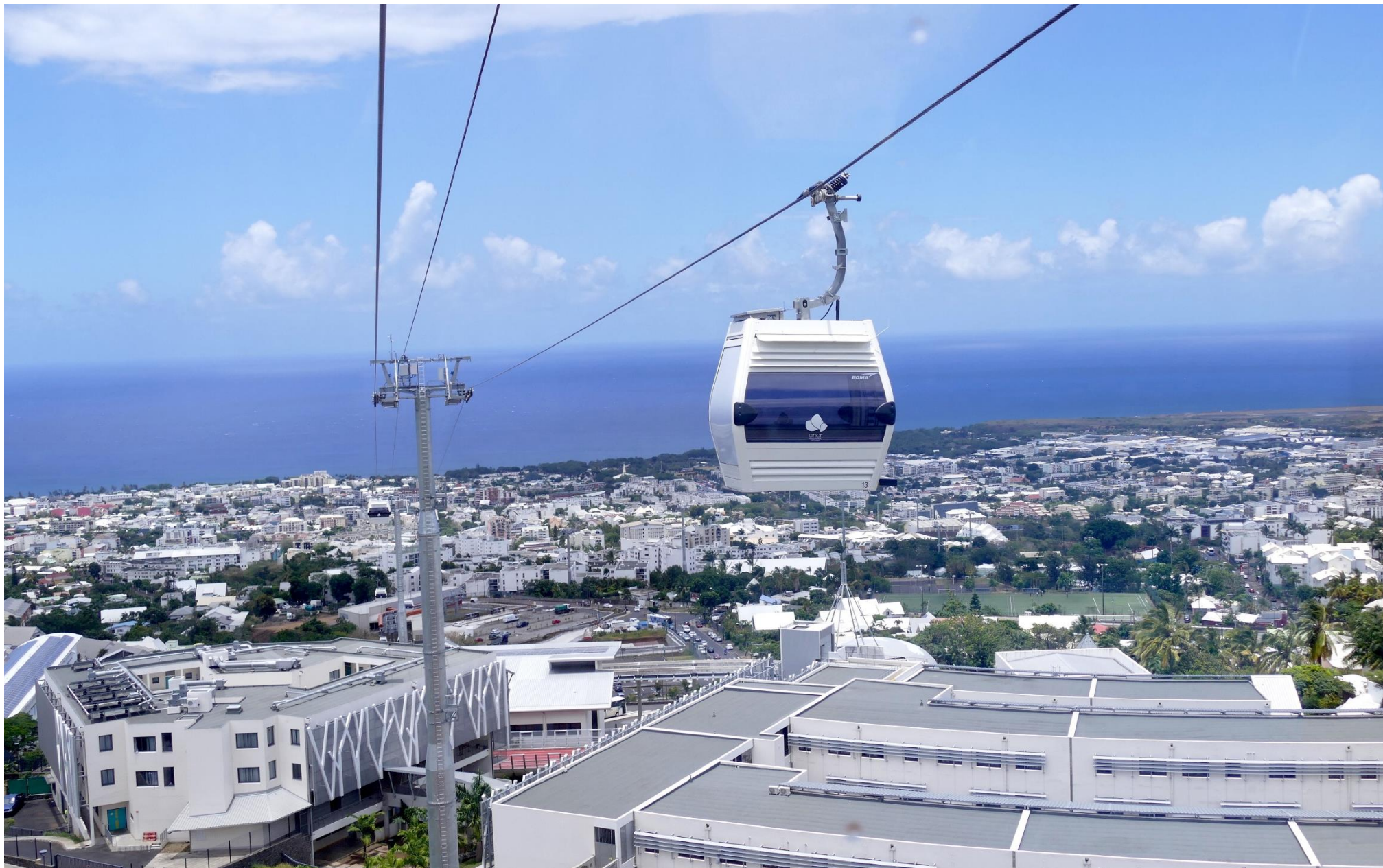
Document 4 – Photographie du téléphérique Papang